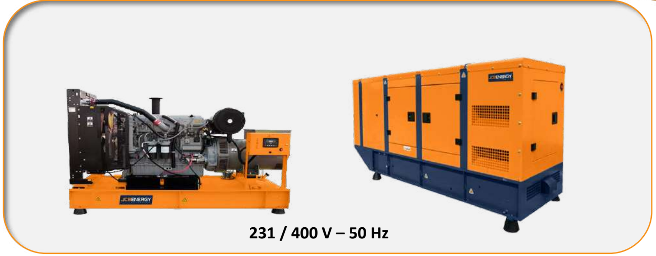
231 / 400 V – 50 Hz